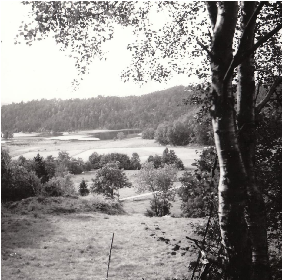
Eldre bilete med utsyn over noko av Miklastofa. Oppe i haugen låg det ei stor steinrøys, og ein trur at steinen med den såkalla gitterhelleristinga er kome herfrå.

Det kunne vera interessant nok å gå vidare inn på denne diskusjonen, men det får liggja i denne omgangen. Poenget her er å gjera lesaren kjend med Lunde og Vevatnet og teoriane kring staden før me ser nærare på emnet for denne artikkelen, nemleg Lundo på Myklestad. Og tanken har altså kort sagt vore denne: Ein gong i ei fjern fortid kom harudane til desse kystane. Med seg hadde dei dyrkinga av grødegudinna Nerthus, som ein gong i året vart vaska i eit heilagt vatn ved ein heilag lund. Til grunn for at dette skal ha vore på Tysnes, og i Vevatnet, har ein Tacitus og stadnamna å støtta seg til: Njardarlog, Lunde, Vevatnet. Ut frå dette, og det som vert sagt å vera munnlege tradisjonar om staden, har ein altså bortimot slått fast at Vevatnet var staden Tacitus skriv om. (Norske historikarar har ikkje vore åleine om slike tankar. Også i Sverige og Danmark har ein slike "Tacitus-vatn".)